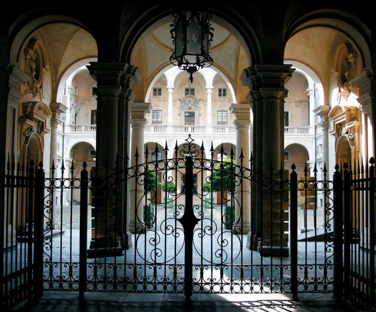
di DANIELA SANTAMARIA calligrafia MASSIMO POLELLO