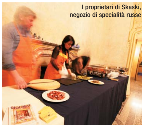
I proprietari di Skaski, negozio di specialità russe