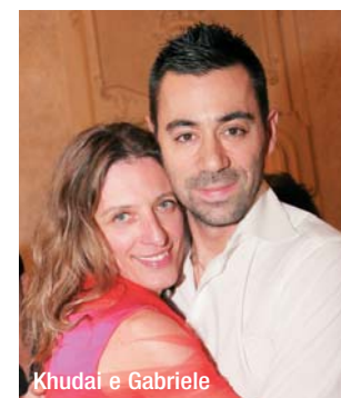
Khudai e Gabriele